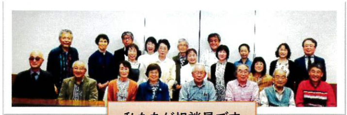
私たちが相談員です

開設以来 39 年、毎年 1,000 件前後、総計 4 万 2,000 件をこえる相談を行っています。 来談者は、当事者をはじめ父母・祖父母・教職員など多岐にわたっています。