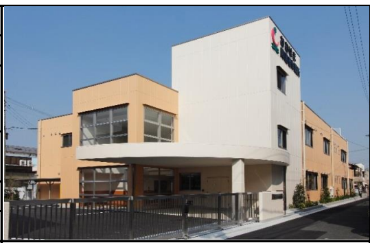
最寄駅 阪堺線 東湊駅